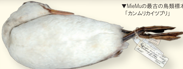
▼MieMuの最古の鳥類標本「カムリカイツブリ」