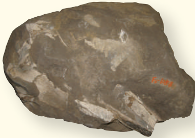
▲「三重県産イルカ頭骨化石」クリーニング後の標本を展示！