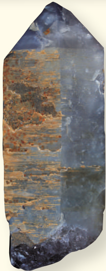
▲重さ約80kg、長さ77cmの巨大な「煙水晶」