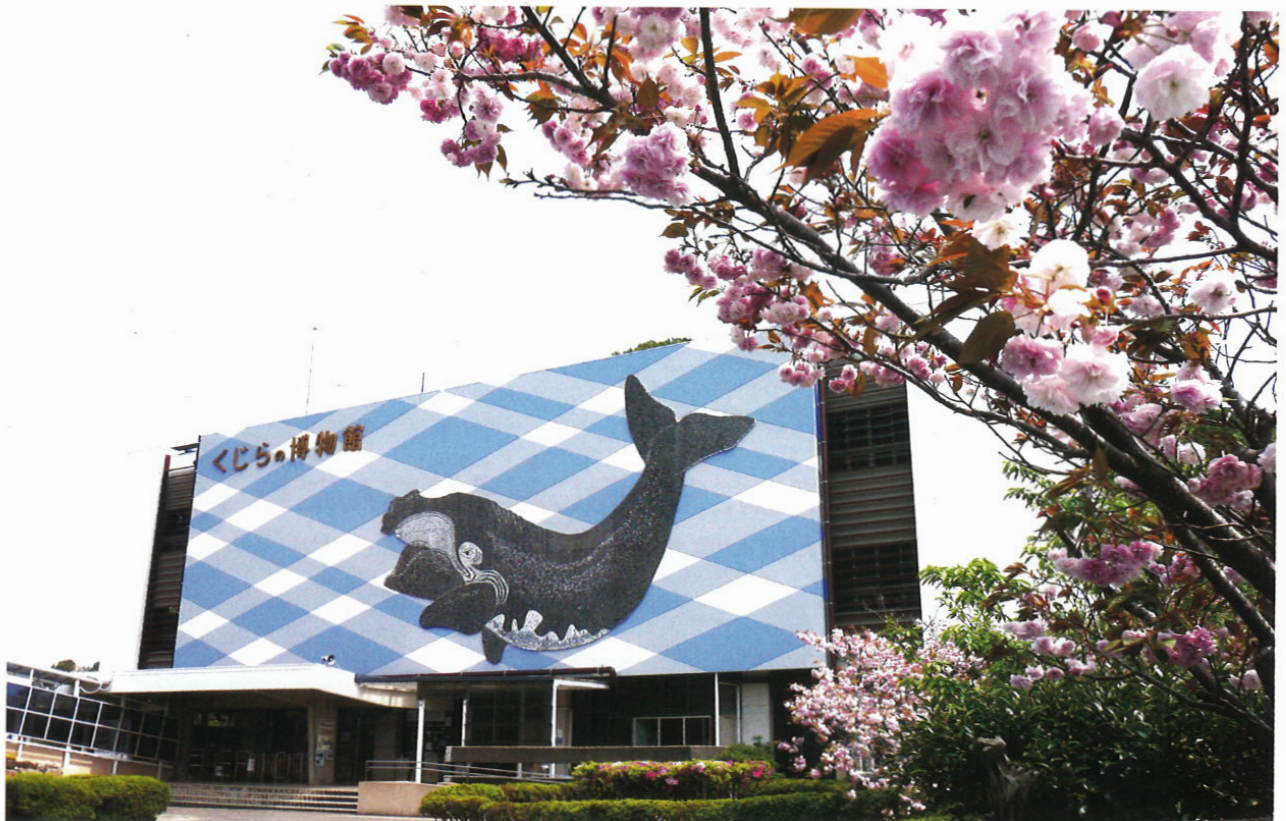
太地町立くじらの博物館